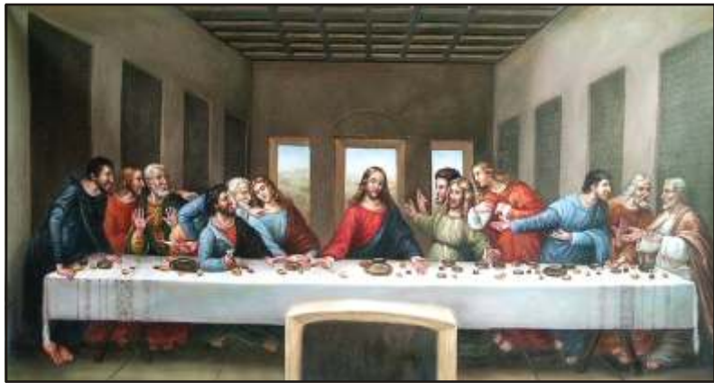
Leonardo da Vinci: Utolsó vacsora

A virágvasárnapot követ hét a nagyhét megnevezést érdemelte ki ünnepeink sorában. E hét csütörtöke a három keserves nap első napja, amikor Krisztus elárulják és elfogják. E napon a tanítványok közös vacsorán vesznek részt a Mesterrel, aki a vendéglátó szerepében a tisztelete jeleként megmossa lábukat, majd a vacsorán úgy is vehetjük, hogy végrendeletként meghagyja az oltárszentség és úrvacsora szokását a b nbocsánat jelképeként. Szavaival végrendeletileg hagyja ránk a „Vegyétek és egyetek... igyatok... testem-véremben l. Ezt cselekedjétek az én emlékezetemre”. Ezen mondatok adják meg e nap fontosságát, melyben kiteljesedik