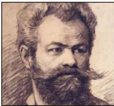
Munkácsy Mihály Trilógiája