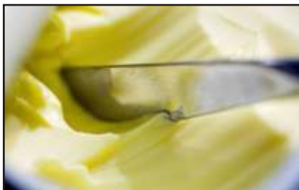
A margarin sokkal károsabb, mint a vaj

Ironikus, hogy a margarin épp amiatt terjedt el ennyire, mert az emberek egészségesnek gondolták. Inkább a margarint választották a zsíros vaj helyett. Viszont a margarin sokkal egészségtelenebb, mint az állati zsírokból készült vaj. Hidrogénezett olajokat, transzszírokat tartalmaz, amik köztudottan cukorbetegséget, rákot és szívbetegséget okoz. (femcafe.hu)