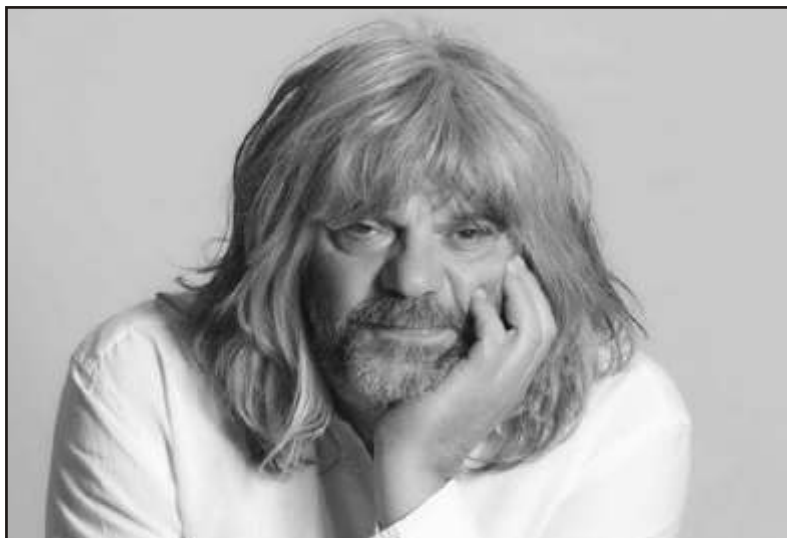
Teleki Napok 2014: „Tudod, hogy nincs bocsánat”