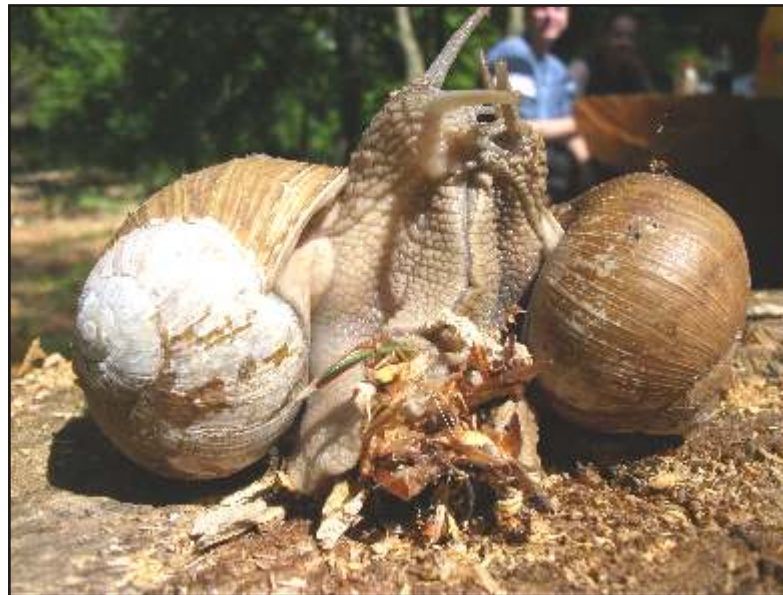
Csiga-nász az avaron, tavasszal

„Ne várj, a legjobb alkalom soha nem fog elérkezni. Kezdj hozzá ott, ahol épen most vagy, és használj bármilyen eszközt, ami csak a kezvedbe kerül, hiszen a legjobb szerszámokat útközben úgys meg fogod találni.” (Napoleon Hill)