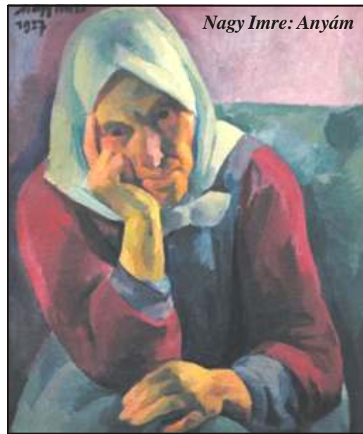
Nagy Imre: Anyám

Nem tagadom, ez szerintem is így van, nagyon is helytálló. Pláne a képzőművész szobrászatában, mely igencsak idigényes munka. Lehet ugyan róla beszélni, filozófolni - kell is néha, hiszen a szobrászat az egyik legfilozófolikusabb, legösszetettebb műfaj a képző-