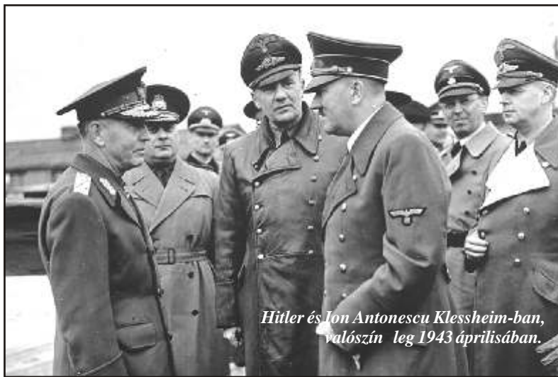
Hitler és Ion Antonescu Klessheim-ban, valószínűleg 1943 áprilisában.

reménysugár, egy csupán elvi síkon létező terv volt. Amikor 1944 októberében Sir Alan Brooke Churchill képviselővel találkozott Sztálinnal Moszkvában, akkor arról beszéltek, hogy ha sor kerülne a balkáni partraszállásra, Magyarországot elkerülve Bécsnél találkoznának a szövetségesekkel az el renyomuló angolszász er k. Merthogy Magyarország Moszkva érdekszférájába tartozott, amit a szövetségesek tiszteletben tartottak. Kállay Miklós meglehető sen nem tudhatott err l, a szövetségesek viszont végig úgy tettek, mintha a tervet véghez akarnák vinni. Persze sejtették, hogy a németek értesültek a tárgyalásokról. Churchillék úgy számoltak, ha ezzel a dezinformációval sikerül kiprovokálni Magyarországon német megszállását, akkor azzal német hadosztályok vonnak el majd a frontról.