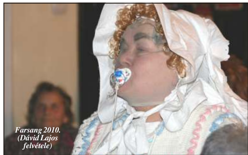
Farsang 2010.

Továbbá szépen kérjük, aki teheti, támogassa tevékenységünket, magánszemélyként vagy céggént is. Sürgős jelleggel szalmára, szigetel anyagra, fedeles anyag vedrekre lenne szükségük ebeinknek. Elérhető: 0771747534. Nevükben is elre köszönjük!