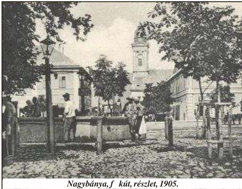
Nagybánya, f. kút, részlet, 1905.

szervez február 22-én a SELMONT étteremben. Jelentkezni lehet a 0362-417818-as telefonszámon.