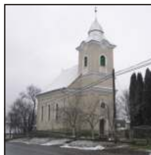
Égerháti református templom (szilagszag.eloerdely.ro)