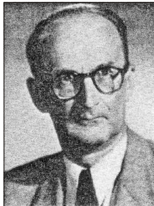
Híres nagybányai orvosok