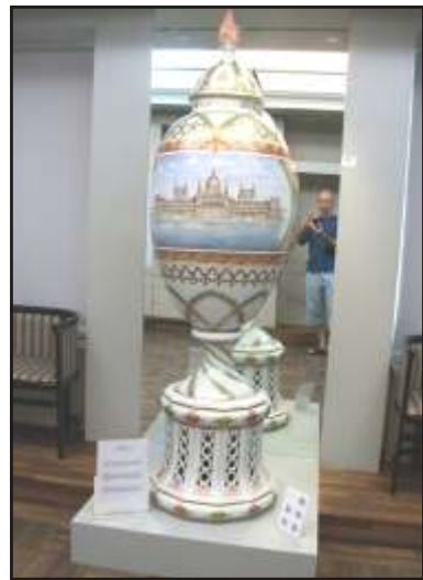
Százmillió forint eszmei értékkel bíró alkotás

kezik. Persze azért egy csekélyke vásárfiát mi, közönséges halandók is vihetünk haza, pár ezer forintért meglephetjük szeretteinket egy amuletellel, vagy éppen egy hűtőmágnessel.