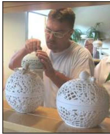
Aprólékos munkával készül a m

Ebéd után először levetítették nekünk egy kisfilmet a gyár történetéről, majd meglátogattuk Európa legnagyobb porcelán manufaktúrájának a bemutató részlegét, ahol egyebek mellett megtudhattuk azt is, hogy a mintegy 700-800 személyt foglalkoztató gyárba nem is olyan könnyű alkalmazottként bejutni. Szigorú vizsgán esnek át a jelöltek, egyebek mellett pszichológiai teszten is, és jó, ha minden tüzedik jelentkezőnek sikerül felvételt nyernie a gyár által működtetett iskolába. Egy dolog biztos: elnézve a bemutatókat, és ismerve saját képességeimet, nem hinném, hogy sikeresen esnek át egy ilyen vizsgán. Márcsak a korom miatt sem, hiszen a felvételi olyan, mint egy pajzán vagy erőszakot bemutató film: korhatáros. Igaz, ebben az esetben a felső korhatárt szabják meg (ami nem lehet több 20 évnél), nem pedig az alsót. Mindenesetre arra felhívnam a figyelmet, hogy illuminált állapotban senki ne látogassa meg a bemutató részleget, illetve a múzeumot, de még a közelben található mintaboltot sem, mert Herenden nem kedvelik az „elefántokat”. Persze, ez utóbbi helyre is csak az a színjőző ember térjen be, aki jó öblös bankkártyával vagy pénztárcával rendel-