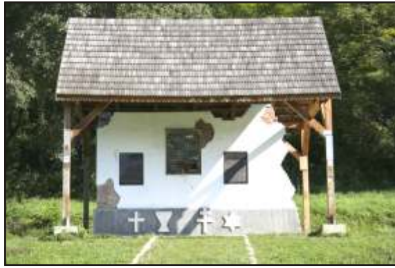
A bözdüjfalu siratófal

Az első ször 1566-ban említett település emléket táblázza a falu egyik domboldali házának falmaradványain. A siratófalon megtalálhatjuk a falu egykori lakosainak a nevét, és az ott gyakorolt vallások jelképeit. Minden év augusztus első vasárnapján összegyűlnek oda a még élő bözdüjfalviak, hogy emlékezzenek. Az 1995-ben Sükösd Árpád által emelt emlékművön a következő szöveg áll: „A tőfene-kén Bözdüjfalu nyugszik, 180 házának volt lakói szétszórva a nagyvilágban ma is siratják. A diktatúra gonosz végrehajtói lerombolták, és elárasztották, ezzel egy egyedülálló történelmi-vallási közösséget szüntettek meg, melyben különböző nemzetiségű és felekezetű családok éltek együtt