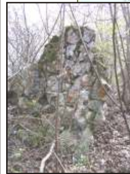
A színérváraljai vár egykori alaprajza és jelenkori romjai.

Mi van akkor, ha az általunk valószínűleg hitt állapot is csak egy álom? Vagy egy álom egy másik álomban? Mi