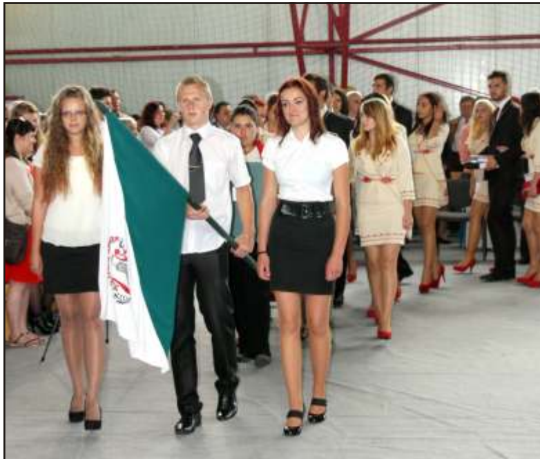
Elballagtak a Németh László Elméleti Líceum három végzős osztályának a diákjai.