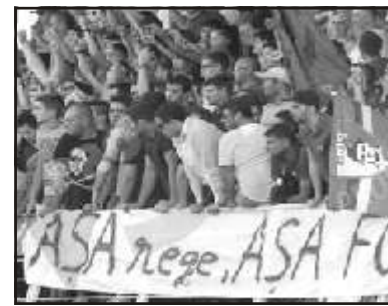
Az oldalt összeállította: SIMORI SÁNDOR

A csoport állása: 1. Olimpia 39, 3. Bihar 29, 3. Mioveni 28, 4. UTA 15, 5. Motru 13. A FCU Craiova visszalépett. (Krónika)