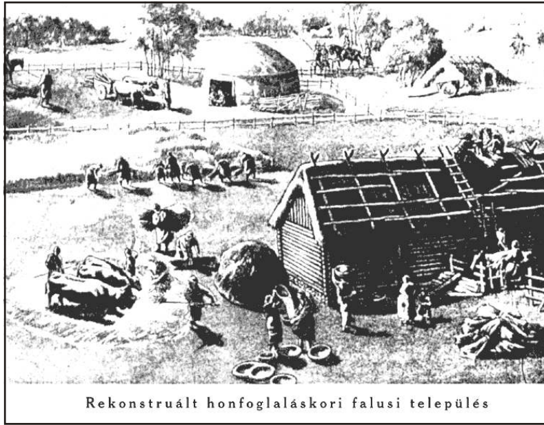
Rekonstruált honfoglaláskori falusi település

Percek alatt berendezkedtek a barlangba, ami persze nem is volt olyan nagy munka. Avart szórtak a földre, majd