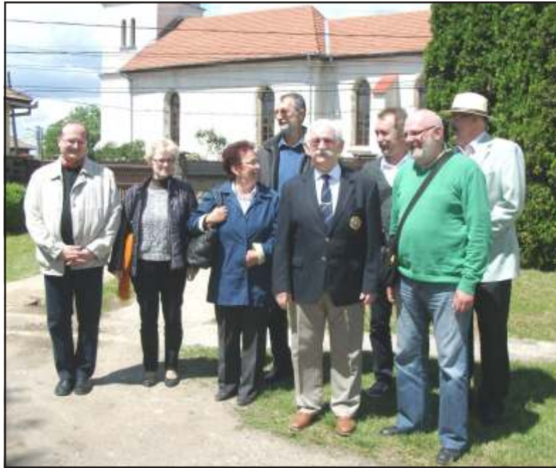
Sárváriak Misztótfaluban

Amennyiben szeretné, hogy lapunk biztosan és időben eljusson önhöz, fizessen elő a Niv Courier Kft.-nél, V. Lucaci utca, 100. szám, tel.: 0262-211266, 0745-918990.