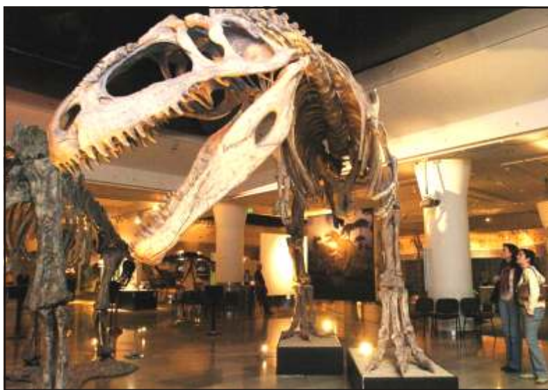
Érdeklődők megnyitása előtt a Patagónia óriás dinó című kiállításon a Magyar Természettudományi Múzeumban. (MTI Fotó: Soós Lajos)

A csibai M szaki Kutatóközpont Ono Szoszuke vezette csoportja modellkísérlettel igyekezett rekonstruálni azokat a körülményeket, melyek a Föld utolsó nagy fajpusztulását idézték el . Abból a feltevésből indultak ki, hogy a mexikói Yucatán-félszigeten felfedezett, csaknem kétszáz kilométer átmérőjű Chicxulub-kráteret aszteroida becsapódása hozta létre. A kisbolygó 12-15 kilométer átmérőjű lehetett, és a hirosimai atomrobbanásnál milliárdszor nagyobb energiával ütközött a Földnek.