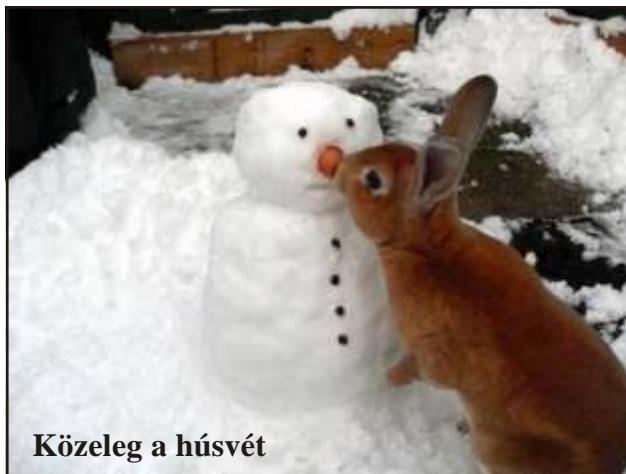
Közeleg a húsvét

- Tudom, hogy úgy kellett volna, de sajnos nincs nagy l. - gyakorlatom.