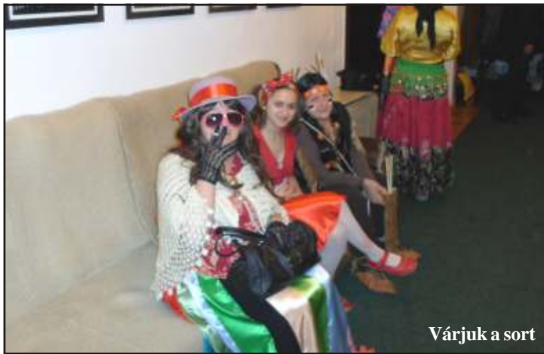
Várjuk a sort

A IV. nagybányai Háló-s farsangi batyubál mottója: „Evezd a mélyre és vedd ki a hálót”. A nagybányai Háló idén ünnepli 10. évfordulóját.