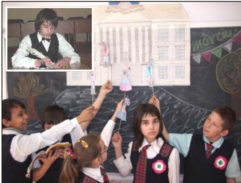
Így szemléltették az 1848-as eseményeket a színérváraljai gyerekek a 2011-es megemlékezés alkalmával.