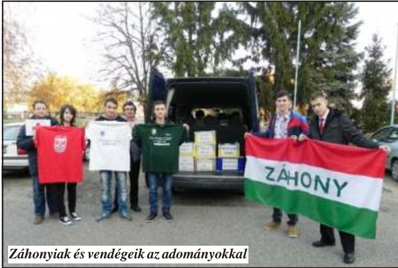
Záhonyiak és vendégeik az adományokkal