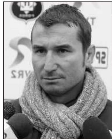
képvisel i, valamint Victor Ponta kormányf jelenlétében. (A Krónika nyomán)

„A keretegyezmény rögzítené az alapelveket és a szükséges intézkedéseket ahhoz, hogy Romániát visszahozzuk a sportvilág élvonalába. Ez részletesen felvázolná a hazai sportinfrastruktúrára vonatkozó befektetési terveket is, mert hosszú távú stratégia nélkül nem nyerhetünk. Els lépésként egy sz k munkacsoportra lesz szükségünk, amely mindezeket összeállítja 2015 második harmada el tt” – közölte a COSR-vezet a sportminisztérium és a sportági szövetségek