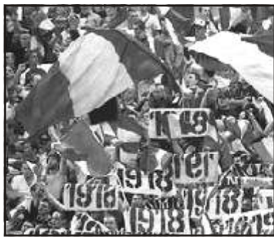
Az oldalt összeállította: SIMORI SÁNDOR

Az Európai Labdarúgó-szövetség (UEFA) fegyelmi bizottságának számolója szerint a botrányos találkozó miatt mindkét felet szektorbezárással, valamint pénzbírsággal sújtotta. A ma-