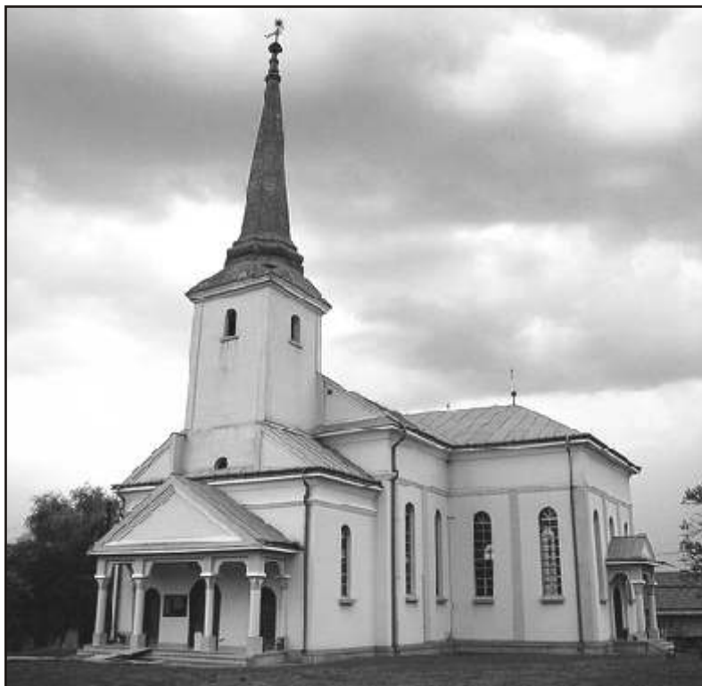
A régebbi templom helyén 1988 után felépült 1000 férőhelyes, keresztthajós avasújvárosi templom a helyi református közösség szorgalmát dicséri, akik naponta 200-250-en vettek részt az építésében. A templombelső, méretével, a formák és színek harmóniájával, orgonájával bármely gyülekezet számára példaértékű lehet.

Kálvin első magyar tanítványa Belényesi Gergely volt, aki feltett szándék-