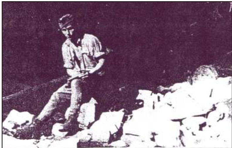
A Burcselék-pataknál. - Bukovina, 1944. július 10.

Tomántól, Tábori fhdgy. lovászáttól hallottuk, hogy a mieink két falut foglaltak el az éj folyamán. A nevüket nem tudja. „Azért volt az a nagy lövöldözés éjfél előtt” - mondták az öregek, akik elmentünk voltak szolgálatban. Fenntartással vesszük ezt a hírt is!