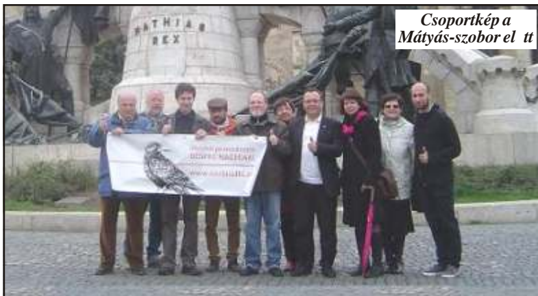
Csoportkép a Mátyás-szobor előtt

amelynek az egyik alapvető tünete a „nem te voltál itt előbb, hanem én”