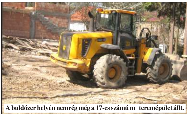
A buldózer helyén nemrég még a 17-es számú m teremépület állt.

Remélem, hogy jegyzetem tartalma eljut a polgármester-jelöltek fülébe is. Arra kérem a leendő polgármestert, hogy tiltsa meg a NAGY KASZÁSOK jelenlétét a kiskertekben, amelyeket jól láthatóan a lakosok nagy szeretettel gondoznak. Foglalkozzanak k csakis az elhanyagolt közterületekkel, de csak hozzáért en, nem vandálok módjára, mint eddig.