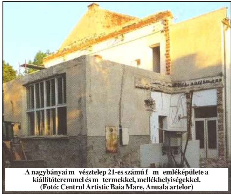
A nagybányai m vésztelep 21-es számú f m emléképilete a kiállítóteremmel és m termékkel, mellékhelyiségekkel.

p módon, a kommunisták által 1972-ben felépített két tömbházszer m teremépületet már szinte teljesen, mondhatni szépen rendbetették! Pedig azok sem voltak jobb állapotban.