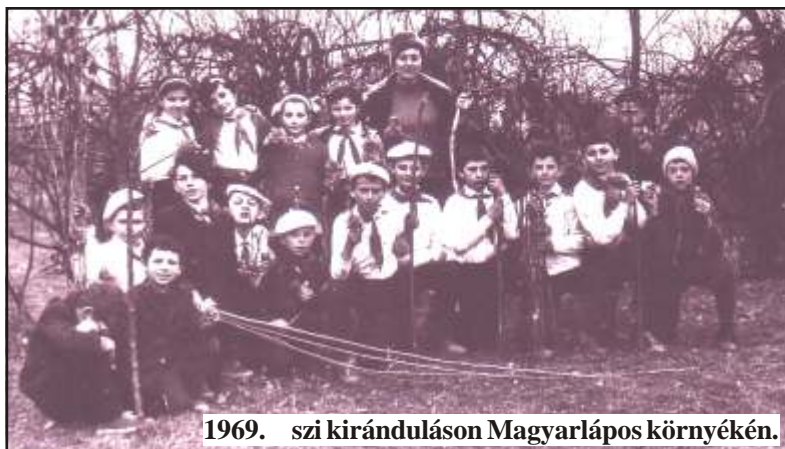
1969. évi kiránduláson Magyarlápok környékén.

Ahogy nőttek a tanulók, tovább mentünk. Voltunk az ún. Bálincóban, az ún. Kiserdőben, ahol kora tavasszal annyi a hóvirág, kökörcsin, kikerics, tiszta zike, péterkulcs, hogy virágszöveget takarja a tisztásokat. Pihenés után falatoztunk, majd csokrot szedtünk (vigyázva a gyökérzetre, hogy jövőre is virágozhasson). A sok csokorból jutott a sírokra is, mert utunk arra vezetett (folytatás a II. oldalon)