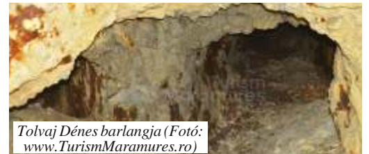
Tolvaj Dénes barlangja

- Legyen áldott a föld, ahol jártál és boldog a nép, kit szerettél! (Kis Kornél Iván)