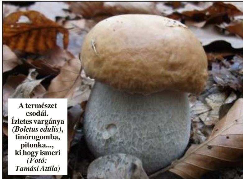
A természet csodái. Ízletes vargánya ( Boletus edulis ), tinórugomba, pitonka..., ki hogy ismeri

A HUNGARIKUM EST szervez. - je a Hollósy Simon M. vel. dési Egylet.