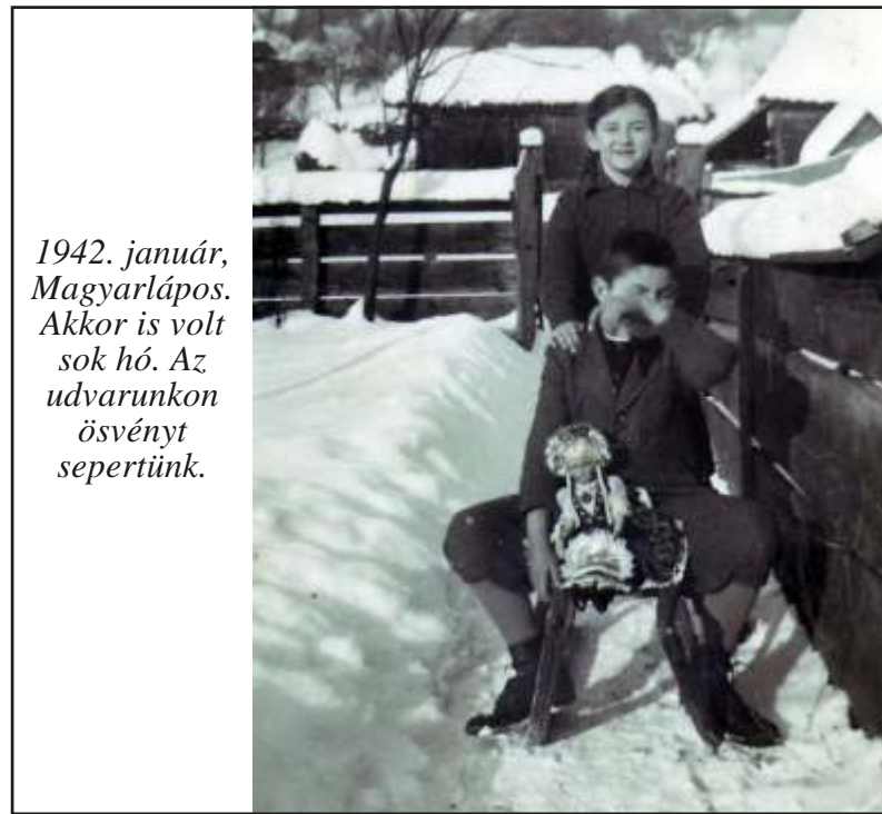
1942. január, Magyarláros. Akkor is volt sok hó. Az udvarunkon ösvényt separtunk.

Az egy órából kettő lett, de senki nem bánta. Otthon a vidám gyermekeket nem kellett unszolni az ebéddel, volt étvágy! A tanulásra is jótékonyan hatott a do-