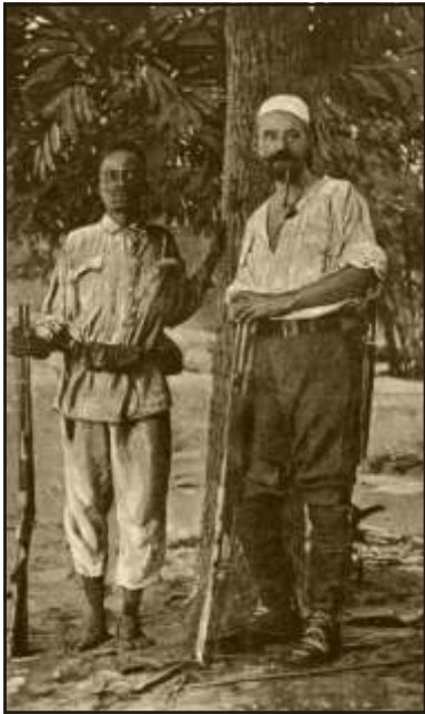
Gróf Teleki Samu Afrikában a szolgálójával - Eredeti afrikai fénykép után

Szászrégeb 1 Marosvásárhely felé haladva utunkba esik Gernyeszeg, ahol Erdély legszebb barokk kastélya található, alig három kilométerrel tovább Sár-