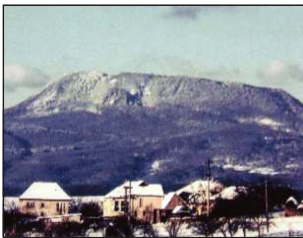
A Sátor-hegy kialakult tzhányója (1041 m), Sztojkafalva néhány házával.

Sztojkafalva. Az 1800-as években élte virágkorát, egészen az I. világháborúig. Ez az országos hírű gyógyvízforrásokkal megáldott fürdőhely Magyarlárosától 7 km-re É-Ny-ra fekszik, a Sátor nevű kialudt vulkánhegység lábánál.