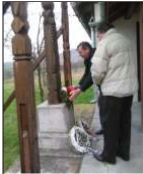
Színváltóján hagyományosan a Zágonyi-kopjafánál emlékeztek meg az 1848-49-es h. sökről