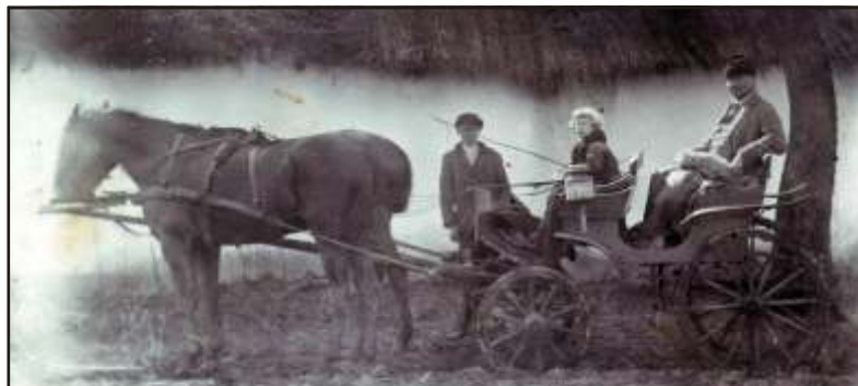
Magyarláros az 1800-as évek végén vagy az 1900-as évek elején. Korabeli közlekedési eszköz várja a vendégeket, hogy Galgóról Sztojkafürdőre szállítsa.