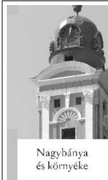
Nagybánya és környéke

Megvásárlásukkal az intézmény m működését is segíthetik!