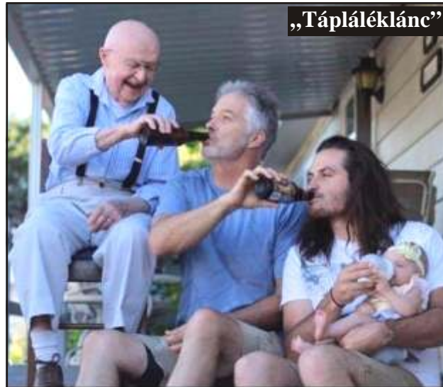
Apukák táplálják a kisfiukat ☺

Székely bácsi komor arccal vacsorázik az étteremben: zavarja a zenekar hangos játéka. Odahívhatja a pincért: - Mondja kérem, fúr, lehet kérni a zenekartól, hogy mit játsszon? - Igen, uram. Mi volna a kívánsága? - Szóljon nekik, hogy amíg ebédelek, játsszanak inkább póktert.