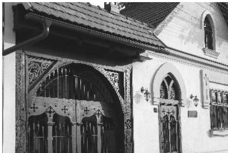
Teleki Magyar Ház

Beszerezhet a Ház irodájában, ára 15 lej.