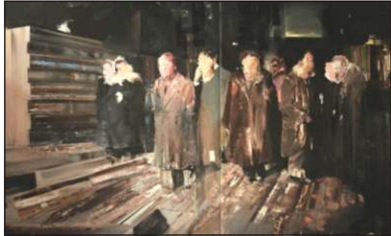
Adrian Ghenie: Nickelodeon (2008)

A művész Kolozsváron végezte képzőművészeti tanulmányait, majd felváltva élt és dolgozott Kolozsváron, illetve Berlinben. Az utóbbi években nagy nemzetközi figyelmet kapott a román képzőművész új vonalának jelentős képviselőjeként. (kronika.ro)