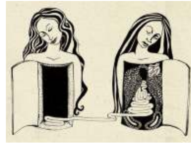
Ocsvai Éva: Szervátültetés

Keresztényi hitvallásunk tanítása szerint, életünket Istenünkől kapjuk, ami