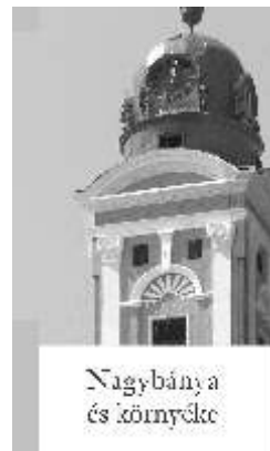
Nagybánya és környéke

Részvétünk a gyászoló családnak! Nyugalma legyen csendes, emléke áldott. A nagybányai Hegyimentek