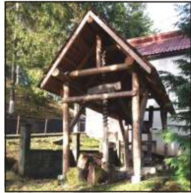
Medvesajtó az 1930-as évek második feléből

a jókedvű szüretesek. Nagyszüleim, dédszüleim idejében énekelve, nótázva mentek és szüretelték a szőlőt, mostanra ez a szokás elmaradt.