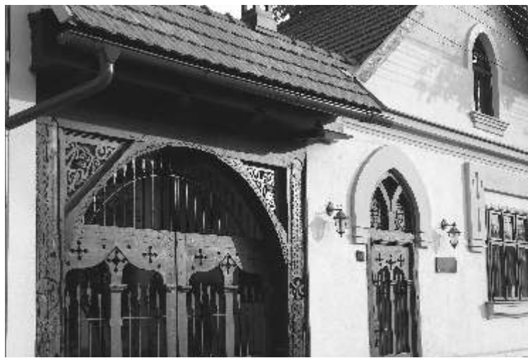
Teleki Magyar Ház