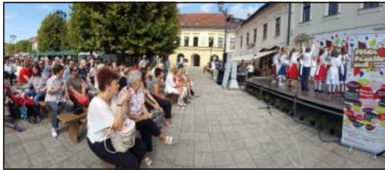
Népi gyermekjátékok, a Németh László Elméleti Líceum alsó tagozatos diákjainak előadása a kisszínpadon