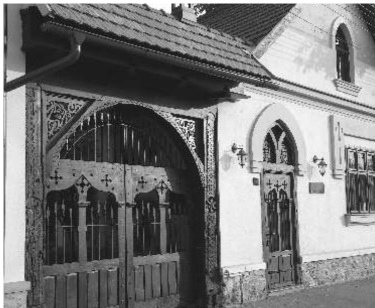
Teleki Magyar Ház

A hazai gazdák egy része úgy véli, túl kés n érkeznek a külföldi földvásárlásokat megakadályozó lépések. „Jóval