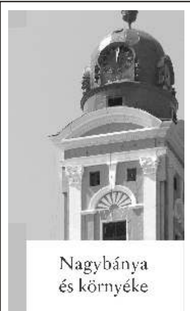
Nagybánya és környéke

A krími háború (1853-56) alatt a Habsburg Birodalom megszállta az Al-Dunát, és Gustav Vex hadmérnök elkészítette a Vaskapu-csatorna terveit. A háborút lezáró párizsi béke kimondta a dunai közlekedés szabadságát, így a Vaskapu-szabályozás nemzetközi kérdés lett. 1871-ben a Dunai G zhajózási Társaság megbízására Mac Alpin amerikai mérnök készített szabályozási terveket, ám ezek sem valósultak meg. A politikai akadályokat 1878-ban a török uralom alól felszabadult balkáni területek sorsát rendez berlini kongresszus elhárította. Az al-dunai szabályozást az Osztrák-Magyar Monarchiára bízták, amely ennek fejében hajózási illetéket