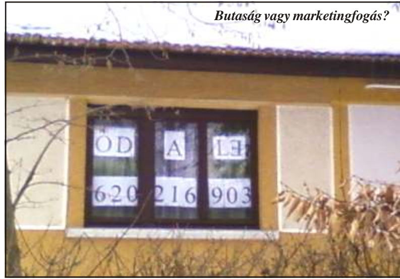
Butaság vagy marketingfogás?

Ha fürdés után tiszták vagyunk, akkor miért kell kimosni a törülközőt?