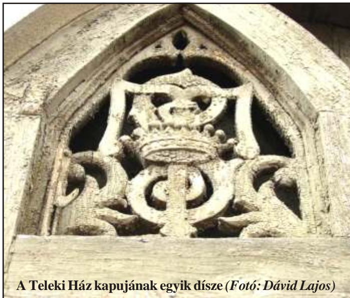
A Teleki Ház kapujának egyik dísz