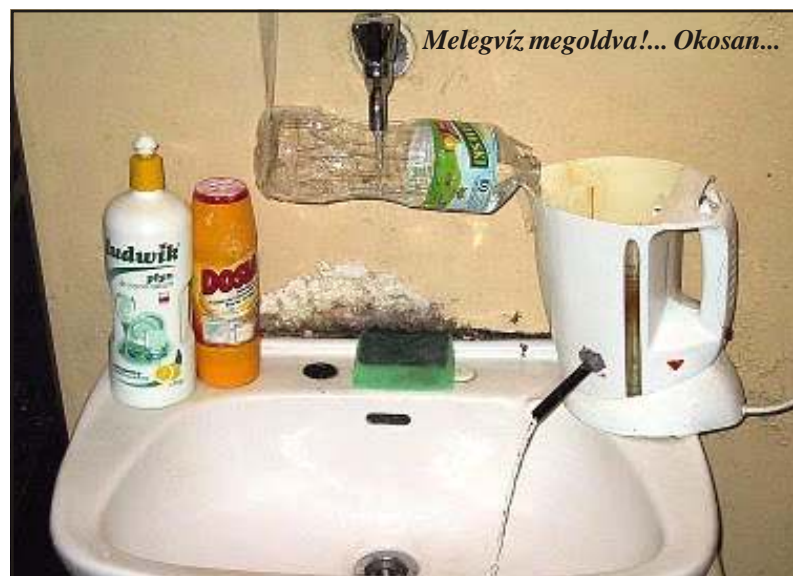
Melegvíz megoldva!... Okosan...

60 felett a férfi olyan, mint Kelet-Európa. Egyfolytában az elmúlt 40 éven gondolkodik, hogy hol rontotta el az életét.