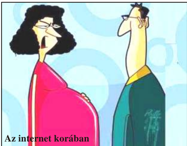
Az internet korában

- Bánom is én, mit gondol a blogod olvasóinak 57%-a, akkor sem lesz a baba neve Skype.