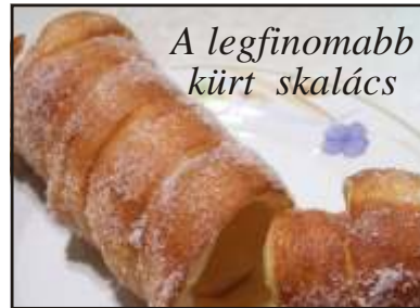
A legfinomabb kürt skalács