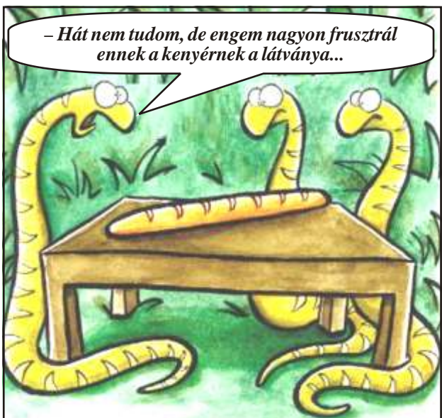
- Hát nem tudom, de engem nagyon frusztrál ennek a kenyérnek a látványa...

Két vállalkozó beszélget: - Tudod, az a baj, hogy az adóhivatal olyan konzervatív. - Hogyhogy? - Már rég 2010-et írunk, és engem még mindig a 2005-ös adóm miatt nyaggatnak.