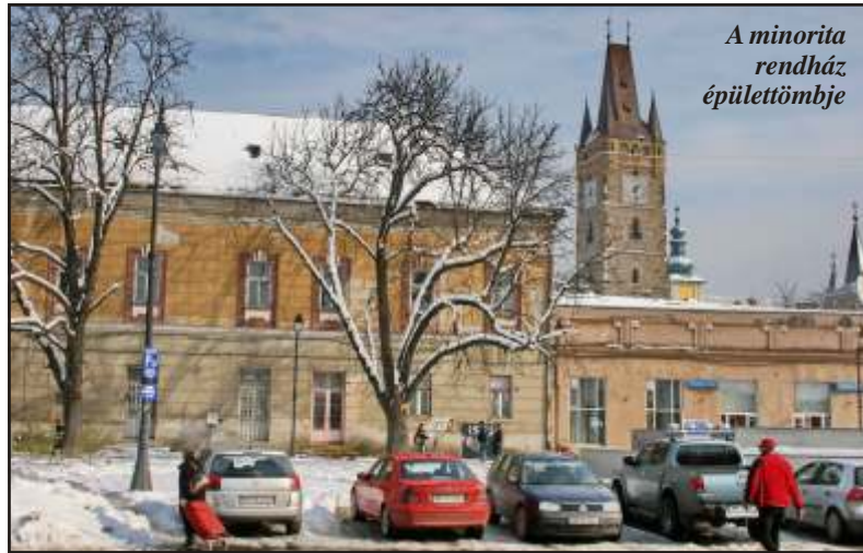
A minorita rendház épülettömbje

házban laknak, birtokba vehették a régi főterületet?