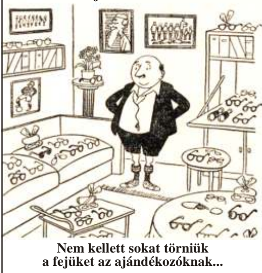
Nem kellett sokat törniük a fejüket az ajándékozóknak...