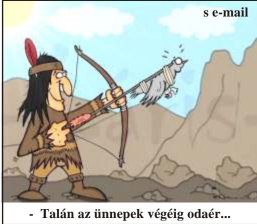
- Talán az ünnepek végéig odaér...

Az év első napján két széken telefonon beszélget: