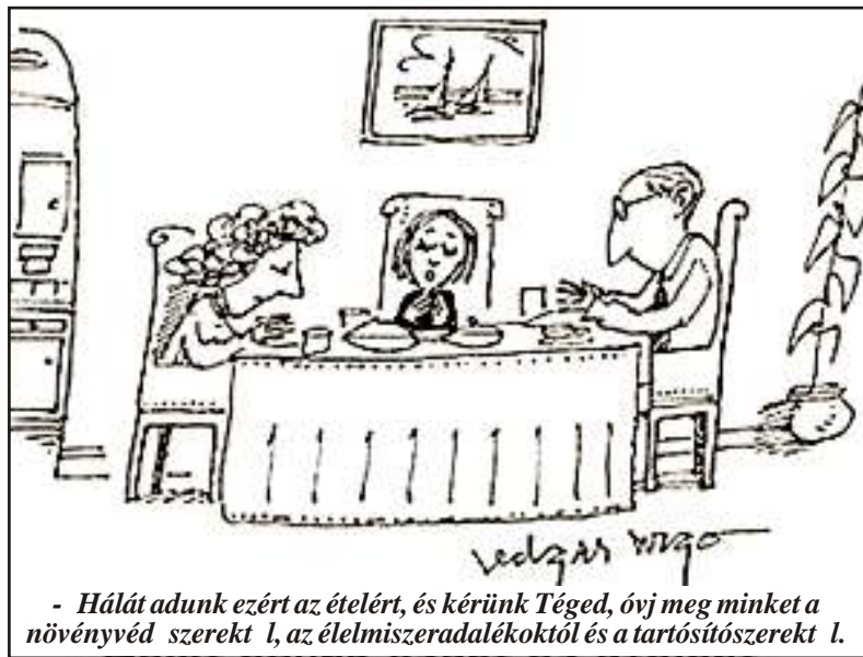
- Hálát adunk ezért az ételért, és kérünk Téged, óvj meg minket a növényvédőszerrel, az élelmiszeradalékoktól és a tartósítószerrel!