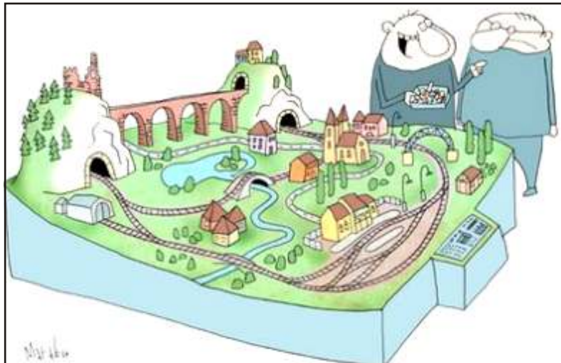
- Ez volt a legnehezebb: hetekbe telt, amíg gipszből elkészült ez a sok kicsi pillepalack, törmelék, lím-lóm, szemét, nejlonzacskó, amit a sínek mellett fogok elszórni.