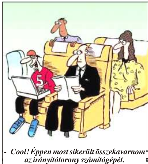
- Cool! Éppen most sikerült összekavarnom az irányítótorony számítógépét.

A híres autóversenyző halálos baleset érte. Az özvegyet behívják, hogy azonosítsa a hullát. A boncmester kihúzza az első fiókot: üres, a másodikat: üres, a harmadikat: üres. Ekkor megszólal az özvegy: - Igen, az, megismerem. Sose volt benne az első háromban!