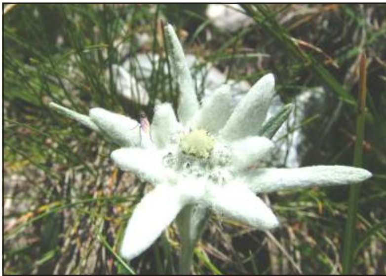
Ha te is szeretnél havasi gyopárt látni és fotózni, lépj az EKE-tagok sorába!

Jelenleg a Megyei Kórház az egyetlen, a Román Akkreditációs Egyesület engedélyével rendelkező máramarosi egészségügyi intézmény, ahol ártámogatott vizsgálatokat végeznek. (tamási)