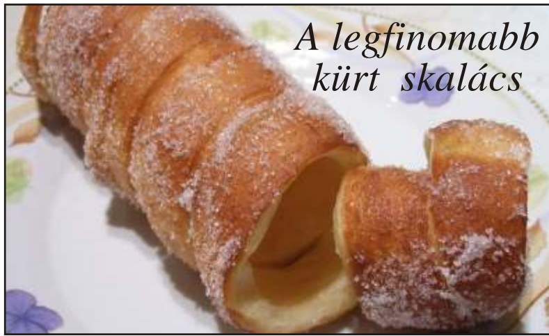
A legfinomabb kürt skalács

Addig se feledjék, szeptember 17 és 19 között jó itthon maradni, jó hazatérni! A szervezést vállaló csapat