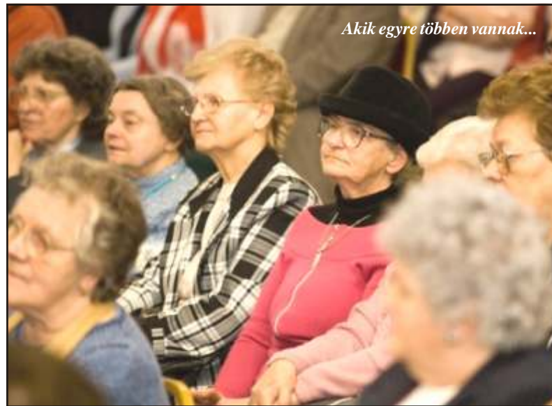
Akik egyre többen vannak...