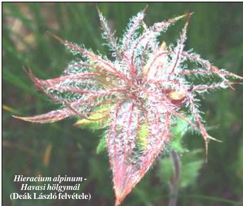
Hieracium alpinum - Havasi hölgyalmá

Megértésüket kérve, tisztelettel: a szerkesztőség