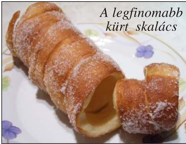
A legfinomabb kürt skalács