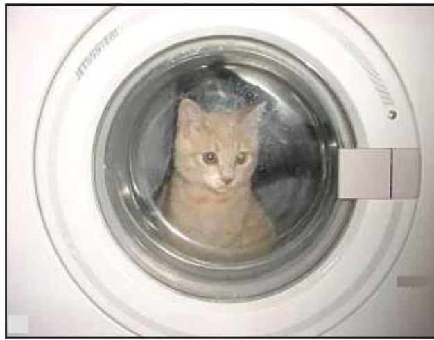
– Azt hiszem, nagyon átverték! Nekem azt mondták, hogy egy repül útra fizetnek be...