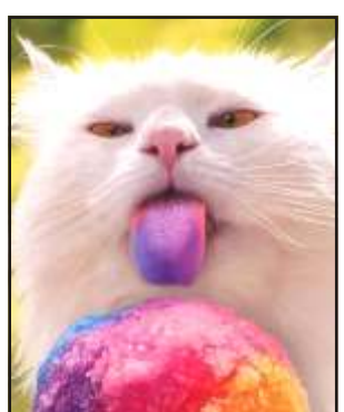
– Jó ez a fagyi, csak kár, hogy nem tonhal íz...

– Nincs semmi gond, kollega, majd a részletfizetési osztályra tesszük.