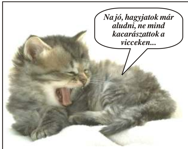
Na jó, hagyjatok már aludni, ne mind kacarászatok a vicceken...

– Sára, Sára! Most már nyugodtan mehetünk nyaralni! Sikerült egy parkolót megszerezni havi 3 centért!