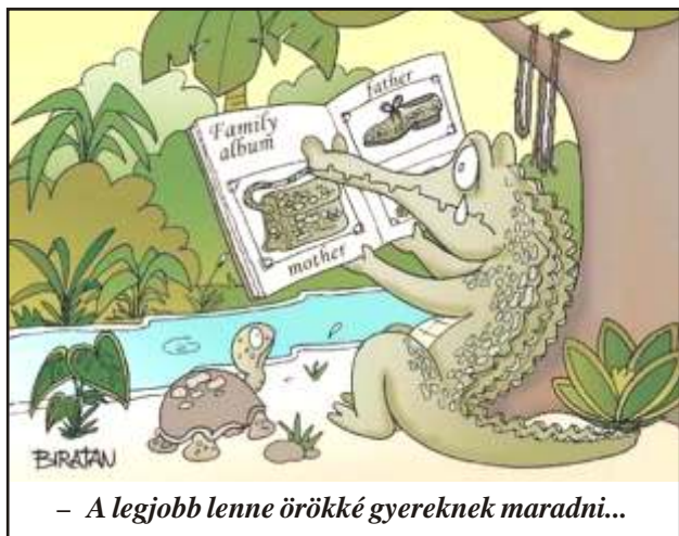
- A legjobb lenne örökké gyerekeknek maradni...