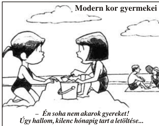
- Én soha nem akarok gyereket! Úgy hallom, kilenc hónapig tart a letöltése...

- Ez a tízes szám jó kabala - mondta el adás után baráti