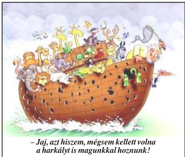
- Jaj, azt hiszem, mégsem kellett volna a harkályt is magunkkal hoznunk!

Két jóbarát megy az utcán. Megkérdezi az egyik: