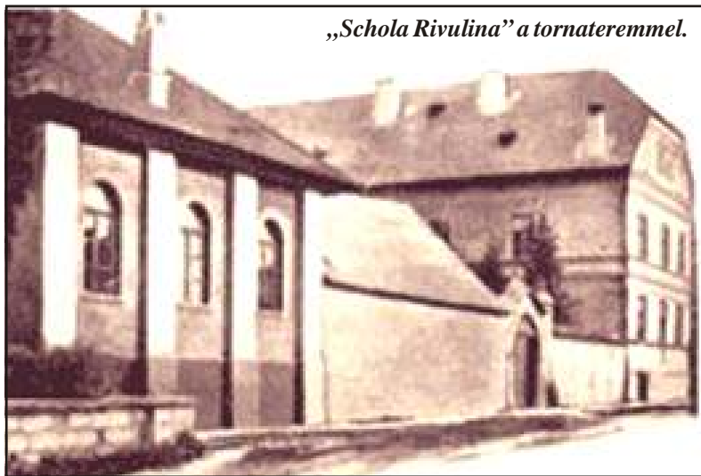
„Schola Rivulina” a tornateremmel.

vítését. A következő évek békés normális tevékenysége után következett a háború befejezése, az ezt követő változások, mígnem az 1948-as Közoktatási Minisztérium 318/1948-as sz. rendelete minden felekezeti iskolát államosított, így a nagybányai is. Az épületben tovább folyt az oktatás-nevelés (1. sz. Nagybányai Magyar Elemi Iskola , majd 4. sz. Általános Iskola ). 1959. szept. 22-én megszűnt az önálló magyar nyelvű oktatás, párhuzamos román és magyar nyelvű oktatás folyt tovább megszűnéséig, 1966-ig. Az intézményben kisegítő oktatás folyt és folyik, azt követően is, hogy az 1989-es utáni nagy változások végére jogaiba helyezték a református egyházat, visszakapta azt az épületet, melyet nagy áldozatvállalással, sok munkásság, izzadságos ingyenes hozzájárulásával hosszú időn át vállaltott magáénak.