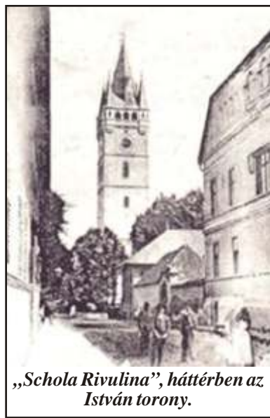
„Schola Rivulina”, háttérben az István torony.

Az iskola működése éveken át nyilvánossági jog nélkül folyt, ezért év végén állami vizsgabizottság el kellett a tanulóknak számot adniuk ismereteikről. Szükséges volt tehát a nyilvánossági jog megszerzése, ám ez csak 1930-ban sikerült. Mindezen idő alatt az intézmény tanteremhiányban szenved, mivel a tanulók száma a korlátozások ellenére egyre nőtt. A bevitel irányába tett lépések visszautasítása 1939-ben szűnt meg, ekkor engedélyezik az iskola b-