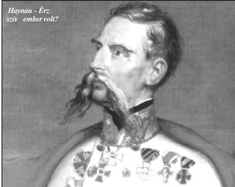
Haynau – Érző szív ember volt?

A Magyarországra bevonuló császári csapatok 1849 tavaszától egy-egy ütközet után, rögtönítél eljárást követően számos esetben végeztek ki polgári személyeket. Többek között például Győr bevételkor, 1849. június 29-én Haynau kivéggetett egy Woititz Adolf nevű 21 éves zsidó fiatalembert és