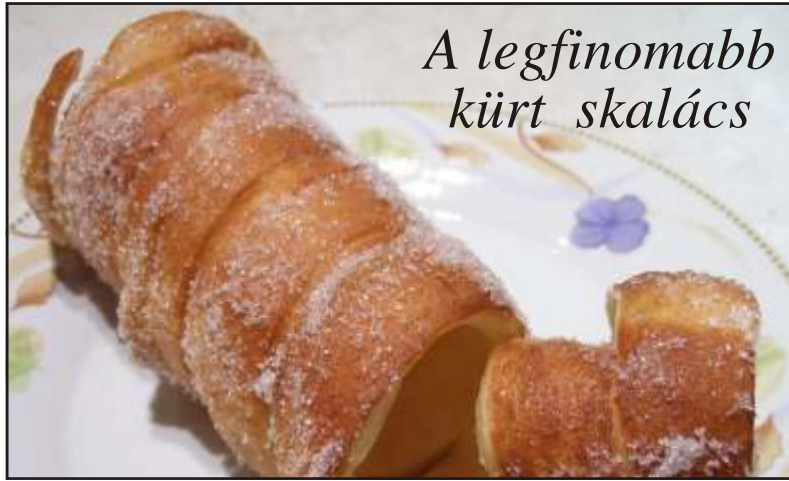
A legfinomabb kürt skalács

* Indul a TÁNCBÁZ! Október 18-án, hétf n 18.00 órától szeretettel