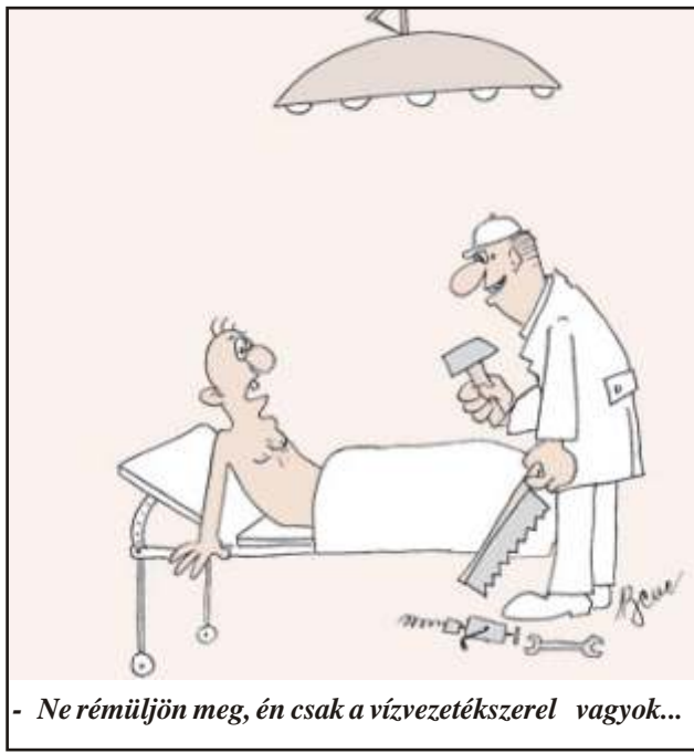
- Ne rémüljön meg, én csak a vízvezetékészrel vagyok...