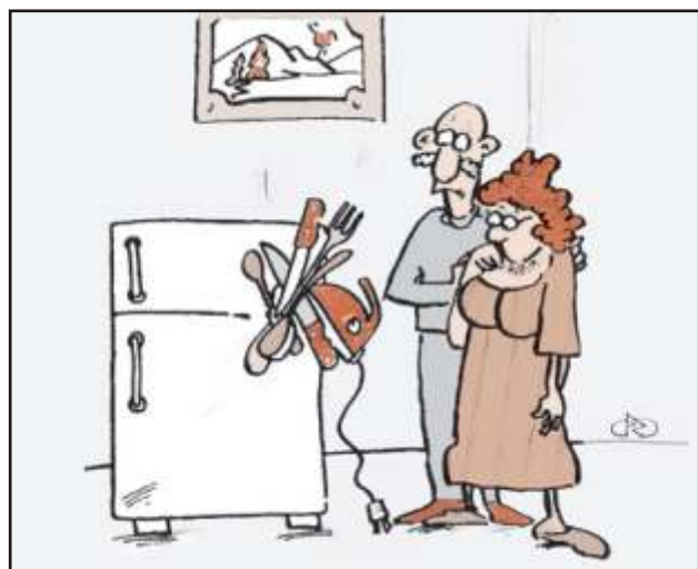
- Lehet, hogy egy gyengébb h t mágnes is elég lenne?