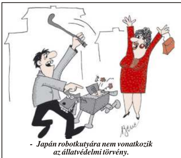
- Japán robotkutyára nem vonatkozik az állatvédelmi törvény.

A házassági ceremónia után az anyakönyvvezet ígyszól: - Most pedig önökhöz fordulok, kedves szül k! El tudják tartani az ifjú párt?