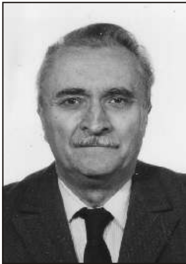
Kulturális Egyesület aktív tagja.

A marosvásárhelyi filmkritikai versenyen első díjat nyert (1956). A máramarosszigeti Hollósy Simon