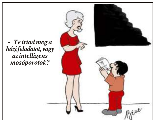
- Te írtad meg a házi feladatot, vagy az intelligens mosóporotok?

A rend r cip t vásárol. Már a nyolcadik párt próbálja, mikor megszólal: