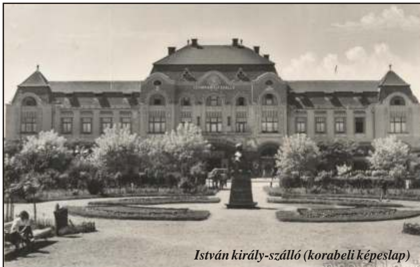
István király-szálló (korabeli képeslap)

A Bányavidéki Új Szó 2011. március 25-i számában „Komoly támogatásban részesült a 26-os óvoda magyar csoportja” című cikkkel kapcsolatban a nagybányai Német Demokrata Fórum közölni kívánja, hogy semmilyen adományozást nem eszközölt a 26. számú óvodának.