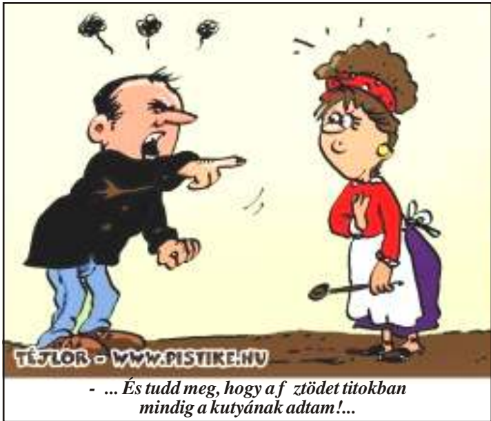
- ... És tud meg, hogy a f ztödet titokban mindig a kutyának adtam!...

- Képzeld, tanárnt, a kézm ves foglalkozásra gyakorolva, papírepült hajtogattam bel le, és valaki eltérítette.