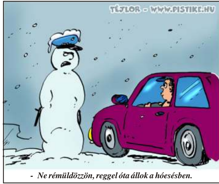
- Ne rémüldezzön, reggel óta állok a hóesésben.

- Móricka, miért nem adtad be a házi feladatodat?