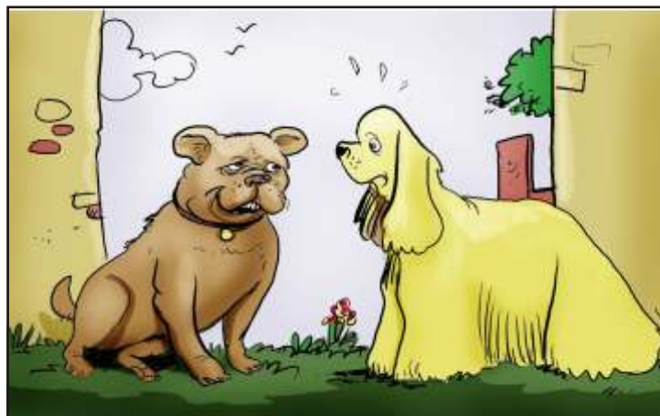
- Hát neked tényleg nem megy semmi..., igazi kókler spániel vagy!