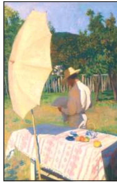
Ferenczy Károly: Október, 1903.

Ma utca viseli a Ferenczy Károly nevet Nagybanányán. Méltó emlékezés ez az itt alkotó nagy m vészre. Valamikor háza, amely a Pet fi utcában található, jelenleg az enyészett martaléka és vev re vár. Valaha egy háromnyelv emléktábla jelölte a házat, melynek kertjében olyan képek keletkeztek mint az Október, vagy a Vörös fal. Csak ennyit érdemelne az az ember, aki nemcsak festményeiben örökítette meg ezt a várost és környékét, hanem ismertté tette ennek a városnak a nevét Párizsban, Münchenben, Európában, de a tengeren túl is, mondhatni az egész világon. A világ