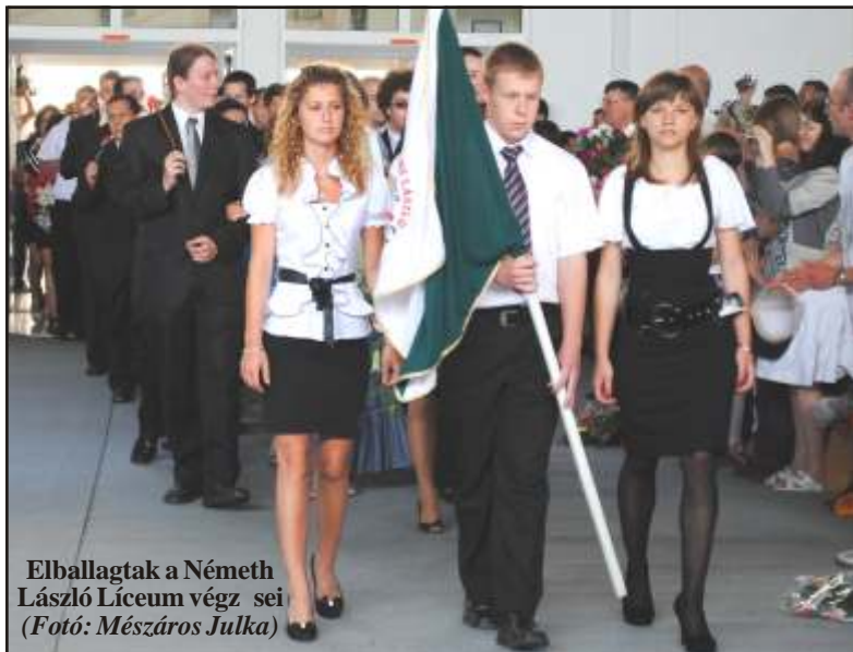
Elballagtak a Németh László Líceum végzősei

A könyv beszerezhető az EKE Gutin Osztályánál (tel.: 0735231716), valamint a Teleki Magyar Házban.