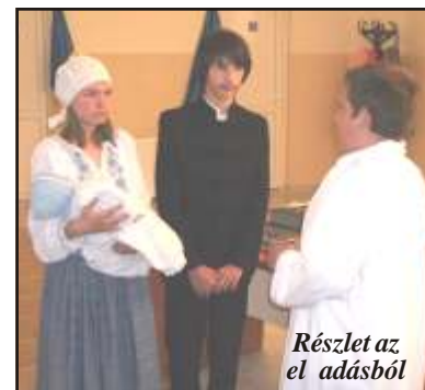
Részlet az élő adásból

A szinerváraljai eseményre az idén 590 esztendősi római-katolikus templom tiszteletére szervezett programsorozat jegyében került sor. (Tamási Attila)