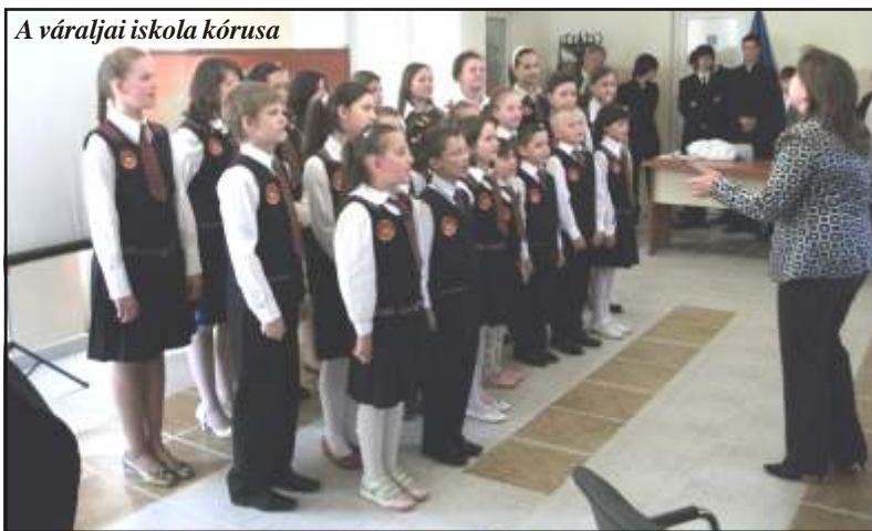
A váraljai iskola kórusa