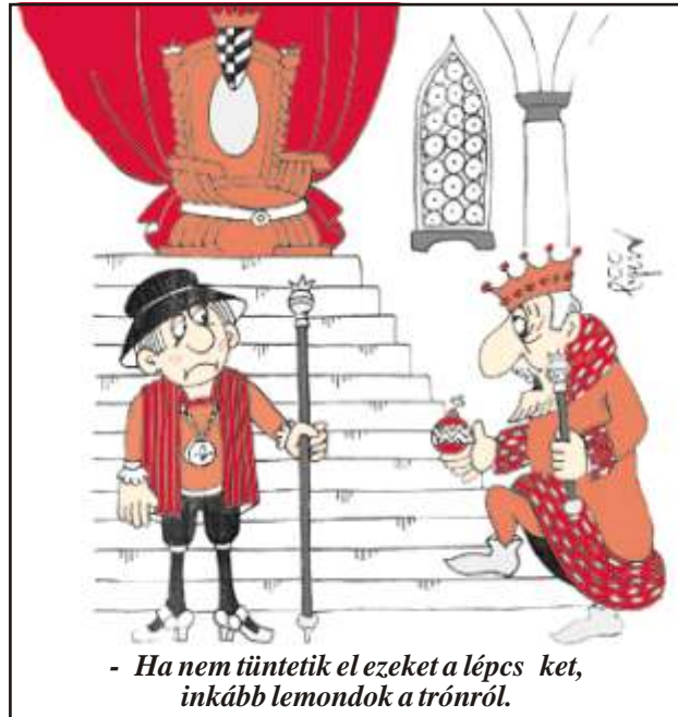
- Ha nem tüntetik el ezeket a lépcsőket, inkább lemondok a trónról.