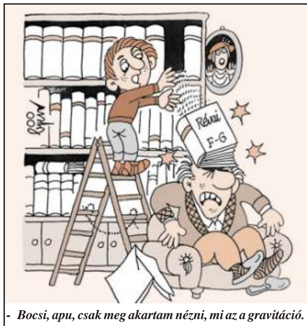
- Bocsi, apu, csak meg akartam nézni, mi az a gravitáció.

- Szenzációs kiadás! Ma délig nem csinált hülyeséget a kormány!