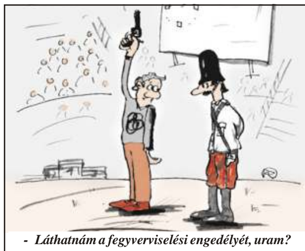
- Láthatnám a fegyverviselési engedélyét, uram?