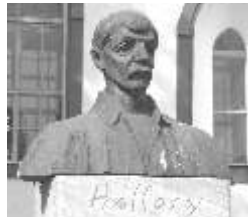
A szigeti Hollósy Ház hírei

Az 500 jegyből leggyenyesebb aki megnyeri, viheti a szerkesztőség tulajdonában lévő festményt.