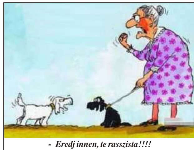
- Eredj innen, te rasszista!!!!

A tévedésért elnézést kérünk az olvasóktól és a szerz t l.