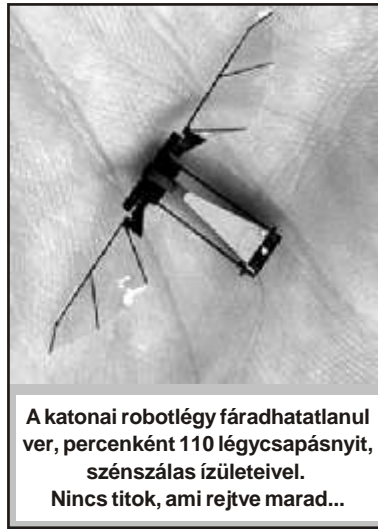
A katonai robotléggy fáradhatatlanul ver, percenként 110 légyecsapásnyit, szénszálas izületeivel. Nincs titok, ami rejtve marad...

fejlesztés, ami hasonló célt szolgál, a Boston Dynamics lépegető robotja. Ez a tervek szerint 2012-ben készül el, 180 kilogrammot tud cipelni és szintén automatikusan követi a katonákat. A négylábú modelleknek döbbenetes egyensúly-érzékük van, remekül másszák meg az emelkedtet és a jégen is elboldogulnak. A robot „fejébe” szenzorokat ültettek, így a kutyaszerű test egy rovarra emlékeztet: fejfel párosul, elég bizarr külsőt adva a gépnek.