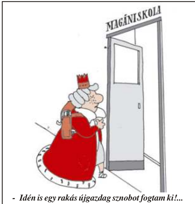
- Idén is egy rakás újjgazdag sznobot fogtam ki!...

Mórickának megdöglik a macskája. A szomszédasszony megsajnálja, és megpróbálja vigasztalni: