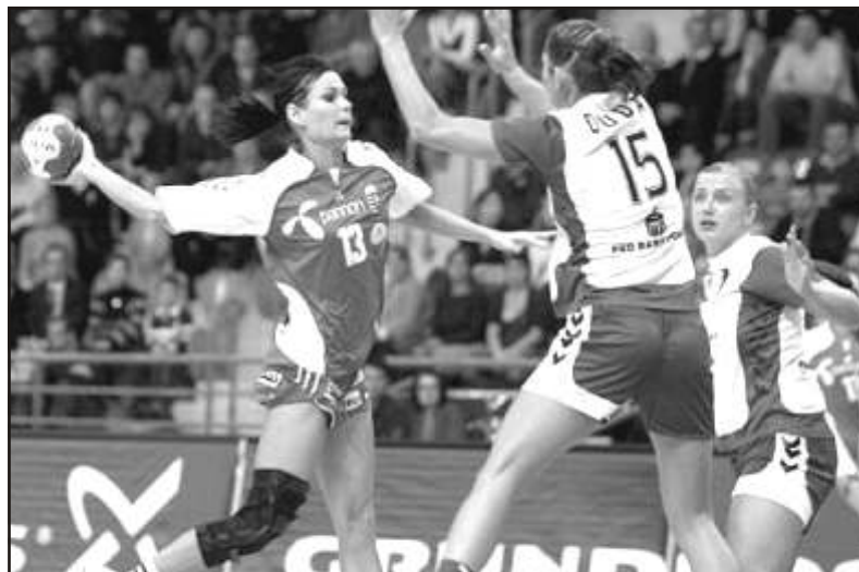
Női kézilabda BL

A hajrában egyértelművé vált, a sorrend, Hamilton növelte előnyét Alonso előtt, míg a harmadik helyért küzd Webber és Button közül utóbbi fért fel a dobogóra. A negyedik Webber mögött Massa lett az ötödik.