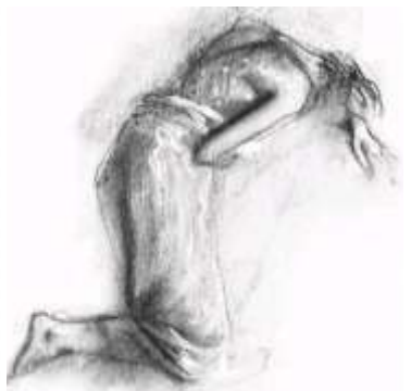
Ferenczy Klára grafikája

Egy kés szí h vös délután Sz kutcákon bolyongva elt n dtem, Az álmainnak tarka fellege, Mint pillangóraj röpködött el ttem. Kopott fény tört a párás légen át S búsmosolyt csalt az ablakok szemébe; Az apró bányászházacska között Csak én voltam s köröttem méla béke. Zeg-zugos utcák síkatorán A testes csend nyújtózott mozdulatlan, Zavartan hallgattam, hogy rossz szívem Most is zsibong: tüzes világú katlan Szemrehúzott kalappal pislogott Bizalmatlan a sok kis ház szemembe. Itt megfeneklett egy darabka múlt, Magába vonultan és elmerengve Már alkonyult, Vöröses fény szítált Lassan a sok-sok kedves régi házra, Az éj paplant terít a földre is És élingat, mint gyermeket mamája.