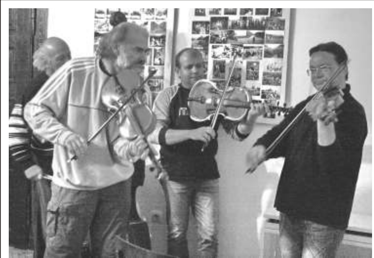
Minden második héten a Gesztenyefa Zenekar muzsikál a nagybányai táncházban. Legközelebb a jövő hétfőn, október 31-én várják el zenével a régi és új táncházakat a Teleki Házba, ott a legapróbbakat, fél héttől a nagyobbakat...