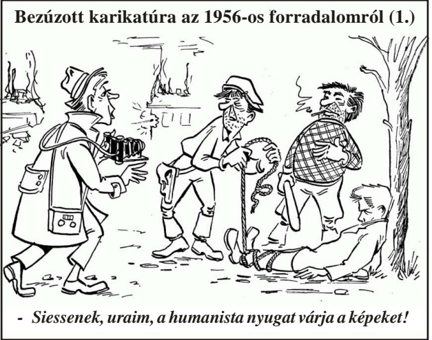
- Siessenek, uraim, a humanista nyugat várja a képeket!

Iskolai dolgozatokból - Vazul, miután megvakították, mehetett amerre látott... - Julius Caesar magáévá tette Galliát, majd behatolt Angliába. - A pun háborúban nagyon sok római elpusztult. Ezek mind Rómába költöztek és proletárok lettek belük. - Az esztergomi püspök lett a primás. - A kaszt zárt társadalmi csoport, ami között csak lélek-vándorlással lehet mozogni. - Athénban azonban kitört a pestis, amelynek az id s Periklesz is áldozatául esett, és ez kissé megviselte a várost. - IV. Béla a tatárjárás után a kihalt nép pótlásáról személyesen gondoskodott. - A költ k csak akkor tudnak verseket írni, ha homlokon csókolja ket egymásra. - Az opera végén Othello ledöfte Desdemonát, aki erre énekelni kezdett. - A Föld nappal a Nap, éjjel pedig a Hold körül kering... - A víz oxigénb l és folyadékából áll.