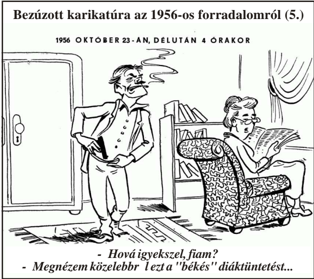
- Hová igyekszel, fiam? - Megnézem közelebb l ezt a "békés" diáktüntetést...

Bezúzott karikatúra az 1956-os forradalomról (4.) TORVÉNYESÉG - Nem baj, kedvesem, én se vagyok szegedi, hanem Szene-gálból jöttem... - Mi az: sárga és öt bet ? - ??? - Sárga. *** - Doktor úr, tud segíteni a feleségemen? Az a mániája, hogy valaki lopja a ruháit. - Valóban? - Igen, már test rt is állított melléjük. Tegnap is, mikor hazamentem, láttam, hogy ott áll-dogál az ürge a szekrényben.