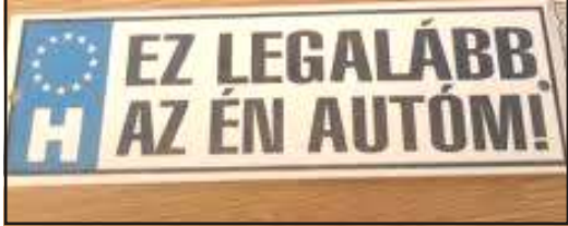
Tréfás rendszámtábla 1.

A tüzegek gyakorlatoznak a l téren. Lövés lövés után, de a célt még véletlenül sem találják el. Az öreg juhász a botjára támaszkodva figyelik őket, végül megkéri a f hadnagyot, engedje meg, hogy is l hessen egyet.