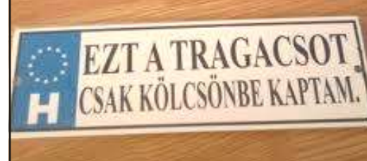
Tréfás rendszámtábla 7.