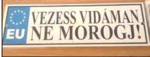
Tréfás rendszámtábla 4.

- Mit áll itt kend hajadonf tt ebben a hidegben?