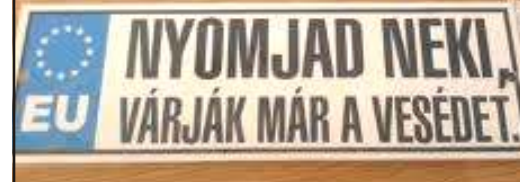
Tréfás rendszámtábla 6.

- Nagyon jó, Pistike, kit n ! Na de meg is tudod nevezni azt az embert?