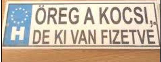
Tréfás rendszámtábla 3.

- Legyen nyugodt, ez csak egy hadgyakorlat.