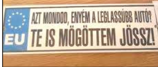
Tréfás rendszámtábla 5.

- A házban ráncba szedtem az asszonyt, most meg kéne egy bátor ember, aki ki merné hozni a kalapot.