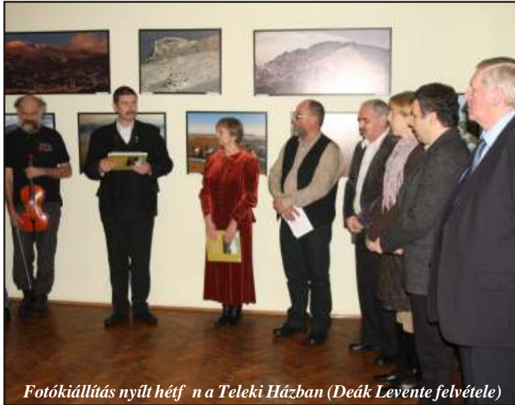
Fotókiállítás nyílt hétfőn a Teleki Házban

Szeretettel várunk mindenkit a megmozdulásra, mert minden nemzetközi és baloldali országgrontó törekvés ellenére: MAGYARNAK LENNI JÓ! – áll az EMNT felhívásában.